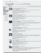
Rápida, clara e em preto e branco