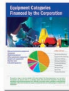
Impressão colorida em alta definição

O Color Access Policy Manager (CAPM) permite o controle e o monitoramento do uso da impressão colorida por meio da definição de quem pode imprimir e o que pode ser impresso. Decida quem e o que pode ser impresso em versões coloridas, branco e preto ou nenhuma impressão, baseando a impressão colorida na relação custo-benefício. Os níveis de acesso podem ser atribuídos pelo nome do usuário, nome do PC/servidor, aplicativo, nome do arquivo e sites. Uma vez configuradas as políticas, o CAPM determina como – ou se – os próximos trabalhos serão impressos. Todas as políticas são