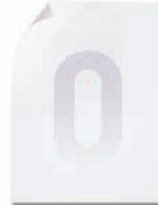
Impressão não permitida