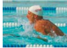
Sem tecnologia Color HD

Exclusiva tecnologia HD Color (Alta Definição) – Proporcionando uma qualidade de impressão que destaca visivelmente os seus documentos, a tecnologia HD Color oferece resultados excelentes.