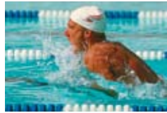
Com tecnologia Color HD

Os aplicativos oferecem controle sobre a qualidade da sua produção, com segurança e controle das suas despesas com impressão. Alguns exemplos de valor agregado: